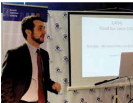
■ S.E. Guela Sekhiaschvili

duos. Tras una transición marcada por el conflicto interno y tensiones étnico-nacionales, las regiones de Abjasia y Osetia del Sur fueron ocupadas por Rusia, que las reconoció como estados independientes, y las poblaciones georgianas de ambas regiones fueron desplazadas forzosamente, lo que se agravó tras la guerra de 2008. En palabras del expositor, Rusia no tolera la autonomía de un estado periférico, y Georgia busca mantener su prosperidad y autonomía basándose en los valores democráticos europeos y en la transparencia gubernamental, evitando el revisionismo histórico acerca de la URSS.