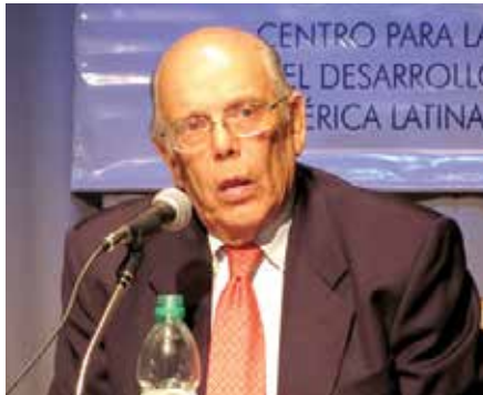
■ Jorge Batlle

Su actitud respecto a la dictadura cubana engrosa la exigua lista de presidentes latinoamericanos que le han